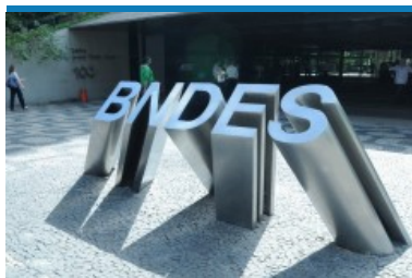
Projeto piloto de "endowment" do BNDES prevê aquisição de novas tecnologias voltadas para a prevenção de crimes

O Banco Nacional de Desenvolvimento Econômico e Social (BNDES) prepara um projeto piloto para estruturar um "endowment" voltado para a segurança pública. Como ainda não possui regulação específica no país, o banco também ajuda na articulação para que a Medida Provisória (MP) editada este ano sobre o tema seja votada no Congresso Nacional.